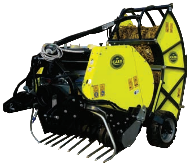
QUICKPOWER 1230 + Bale Transporter 4CM