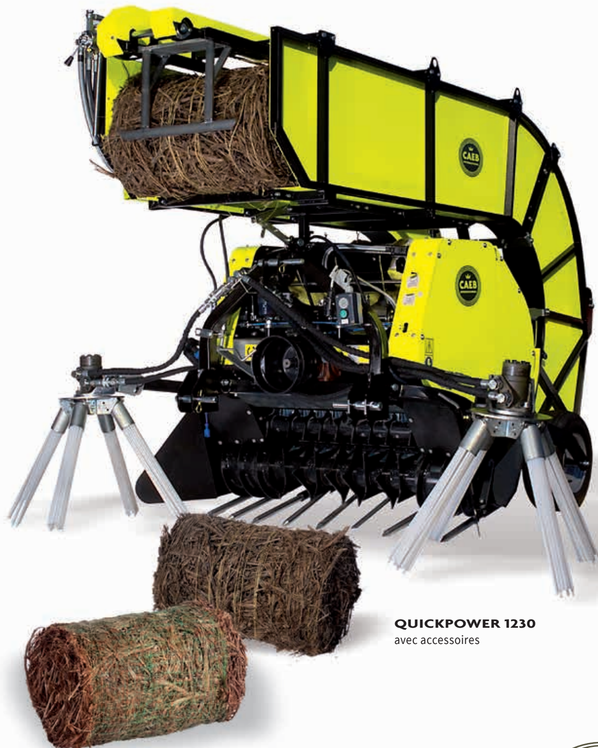
QUICKPOWER 1230 avec accessoires

CAEB INTERNATIONAL srl via Botta Bassa, 22 - 24010 Petosino di Sorisole (BG) - Italy tel. +39 035 570451 - fax +39 035 4129105 info@caebinternational.it - www.caebinternational.it